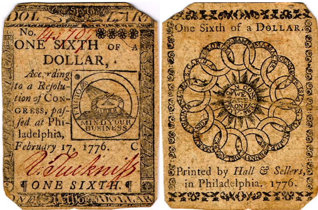
1/6 de dólar, 1776 Cédula fracionária

Outras peças usaram o mesmo design criado por Franklin: as cédulas fracionárias e o dólar continental. As cédulas foram emitidas com os valores de 1/6, 1/3, 1/2 e 2/3 de dólar. O dólar continental foi um ensaio emitido em 1776 mas que não chegou a circular. Há muita controvérsia em torno desta emissão pois, não houve emissão de cédula de 1 dólar, o que leva a crer que esta denominação estava destinada a uma moeda e que este seria um ensaio. Porém, alguns pesquisadores afirmam que os dólares continentais foram apenas souvenirs fabricados na Grã Bretanha. De qualquer modo, a emissão de um dinheiro próprio é sempre um modo de reforçar a independência recém-conquistada e introduzir os novos conceitos para a população do país.