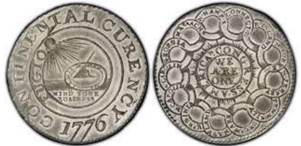
1 dólar (continental), 1776 Ensaio